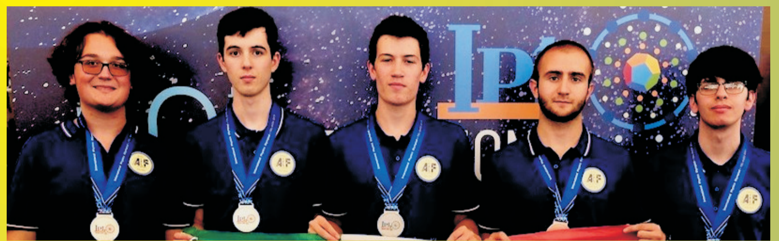
La squadra italiana alle IPhO 2019 (Tel Aviv - Israele)